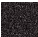
47.02 Gris clair