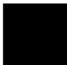
Noir - semblable au RAL 9005