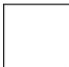
Blanc - similaire au RAL 9010